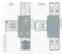
Tente "Le Nid" 6pers. 46m 2 sur 2 niveaux + terrasse couverte