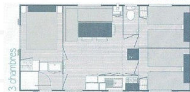
Mobil-home 6 pers. 30m 2 - 3 chambres