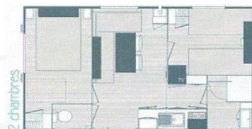
Mobil-home 4/6 pers. 27m 2 - 2 chambres