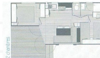
Mobil-home terrasse intégrée 8m 2 4/6pers. 25m 2 - 2 chambres