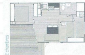
Mobil-home terrasse intégrée 8m 2 5 pers. 22m 2 - 2 chambres