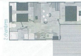
Mobil-home Confort Déclick 5 pers. 28m 2 - 2 chambres