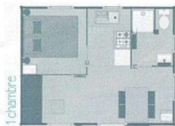
Mobil-home 2/4 pers. 20m 2 - 1 chambre